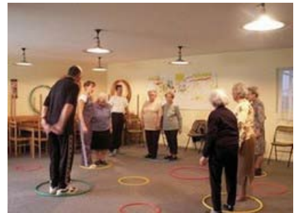
Les exercices proposés ont pour objectif d'améliorer les capacités motrices et l'équilibre des participants

Les chutes étant un événement multifactoriel nécessitant une approche globale de la