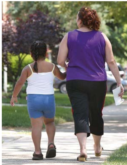
11% de la population est obèse en région PACA.

"Nous sommes à l'écoute des personnes qui viennent nous voir. Nous mettons à leur disposition un lieu d'échange pour exprimer ce dont ils ont besoin, engager la conversation, répondre à leurs questions. Quand ils arrivent, leur demande est principalement de perdre du poids le plus vite possible. Mais ce n'est pas si simple ! Avec un diététicien, nous les orientons vers une alimentation moins grasse et moins sucrée, organisons des cours de cuisine diététique... Nous leur proposons également