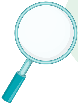
Verso de la fiche de présentation pour l'animateur

Déroulé de l'épreuve et consignes pour l'animateur