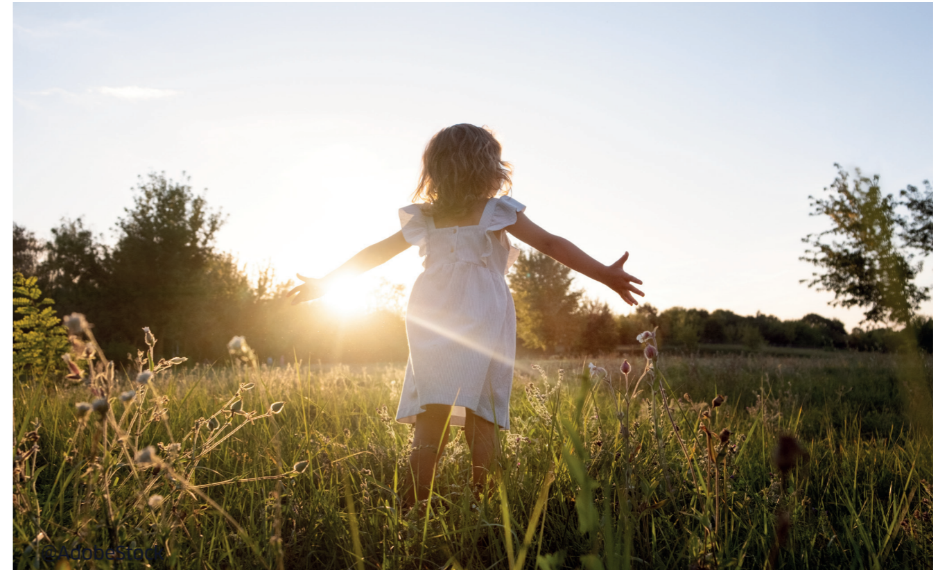
Chaleur du corps